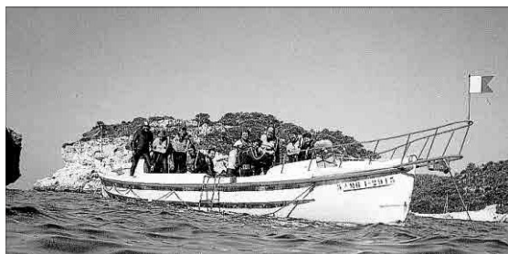
El bot emprat els anys vuitanta del segle passat pel centre de submarinisme de Cala Galdana.

Amarrat de nou en el port, després d'una restauració global, el bot de salvament s'empra en els darrers 25 anys només per a la festivitat dels Reis Magats i per a la processó de la Verge del Carme. El bot de llenya Fornells amb una llarga història de més de 90 anys, sotmès a dures condicions de navegació en un primer període, a una decadència evident servint per unes funcions per les quals no estava preparat en un segon període i a una inactivitat quasi total mentre està exposat al sol i les inclemències del clima marítim en el darrer quart de segle, arriba a un deteriorament que fa perillar la seva permanència surant al port. Les «restauracions» i el «manteniment» realitzats en els darrers anys per professionals que no eren mestres d'aixa, no han ajudat a una