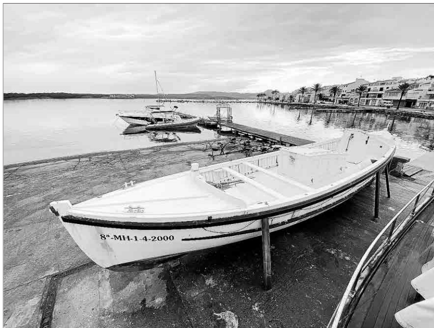
El bot en terra poc abans del seu trasllat per a la restauració futura.

La història del Fornells com bot de salvament actiu acaba el 1971 amb la creació de la Creu Roja de la Mar que absorbeix