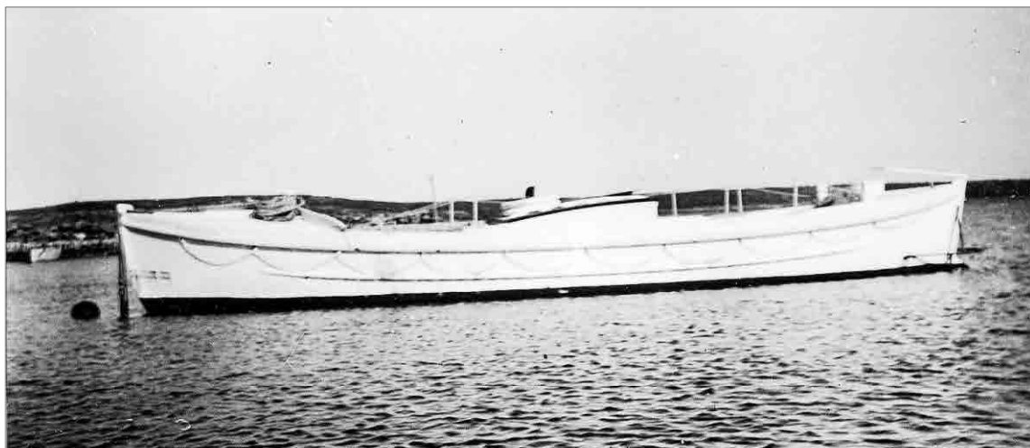
El bot Fornells el 1954.

El desembre de 1880 es va crear la Sociedad Española de Salvamento de Naufragos (SESN) seguint les pautes i l'experiència de la Royal National Lifeboat Institution fundada el 1854. El funcionament de la SESN va ser descentralitzat i eficient. Es basava en un Consell Superior i una Comissió Executiva Permanent radicats a