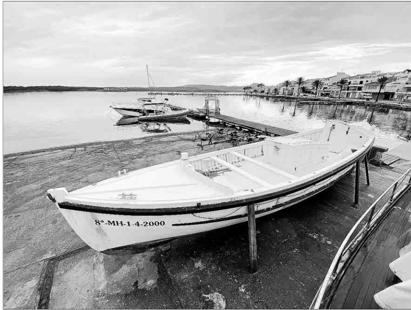
El bot en terra poc abans del seu trasllat per a la restauració futura.

La història del Fornells com bot de salvament actiu acaba el 1971 amb la creació de la Creu Roja de la Mar que absorbeix