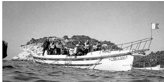
El bot emprat els anys vuitanta del segle passat pel centre de submarinisme de Cala Galdana.

Amarrat de nou en el port, després d'una restauració global, el bot de salvament s'empra en els darrers 25 anys només per a la festivitat dels Reis Magats i per a la processó de la Verge del Carme. El bot de llenya Fornells amb una llarga història de més de 90 anys, sotmès a dures condicions de navegació en un primer període, a una decadència evident servint per unes funcions per les quals no estava preparat en un segon període i a una inactivitat quasi total mentre està exposat al sol i les inclemències del clima marítim en el darrer quart de segle, arriba a un deteriorament que fa perillar la seva permanència surant al port. Les «restauracions» i el «manteniment» realitzats en els darrers anys per professionals que no eren mestres d'aixa, no han ajudat a una