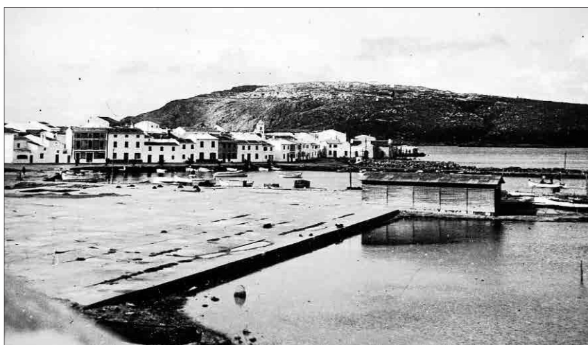
Segona caseta de llenya de l'estació de salvament de Fornells.

Madrid que coordinaven i oferien ajuda econòmica, tècnica, de formació i d'informació a les juntes locals de les diverses poblacions que es formaven i actuaven de forma completament autònoma. La SESN va donar un gran servei a la navegació i a la gent de la mar: entre la seva creació el 1880 i l'inici de la Guerra Civil el 1936 s'havien creat 63 estacions de salvament a tota la costa espanyola i fins la seva desaparició i integració a la Creu Roja del Mar, el 1971, va intervenir en el salvament de 16.723 persones.